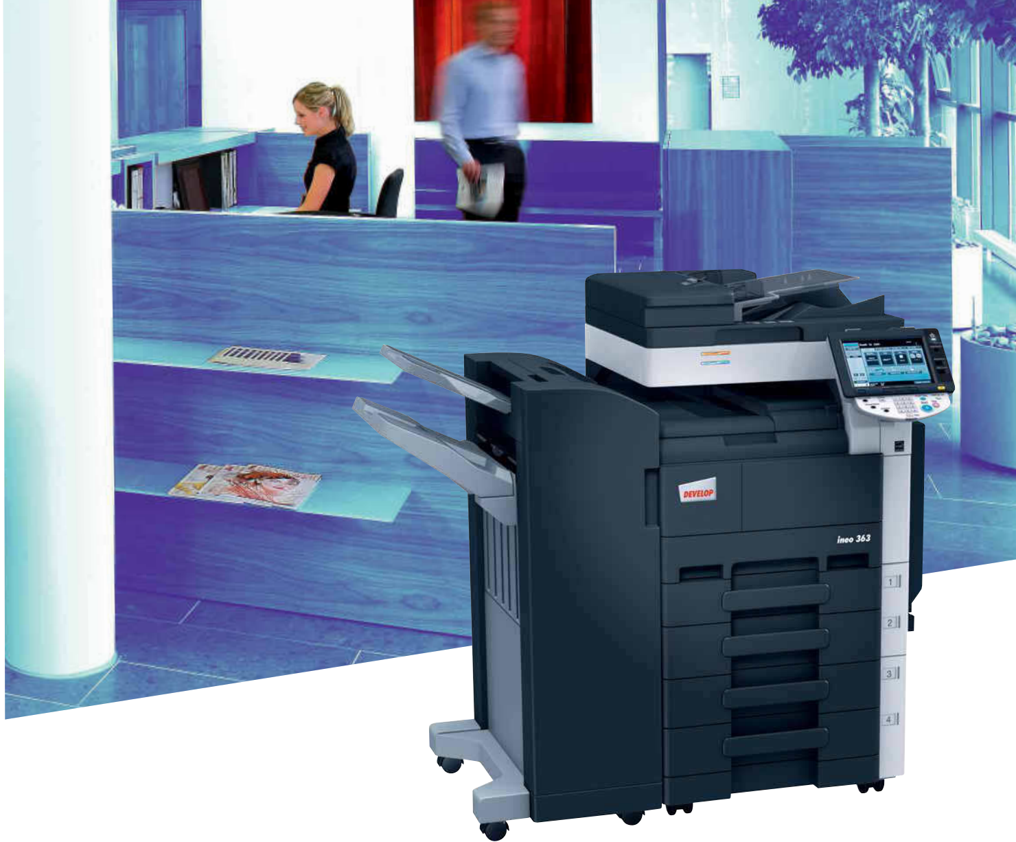
ineo 363 mit Standfinisher (FS-527) und Papierkassette (PC-208)