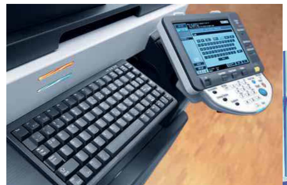
ineo 363 farbiges Touchscreen Display und optionale Tastatur für einfache Eingabe

Profitieren Sie von einem perfekten Team und nutzen Sie die ineo 363 für die Dokumentenproduktion in Schwarzweiß kombiniert mit den ineo+ Systemen für die Erstellung professioneller Farbdokumente.