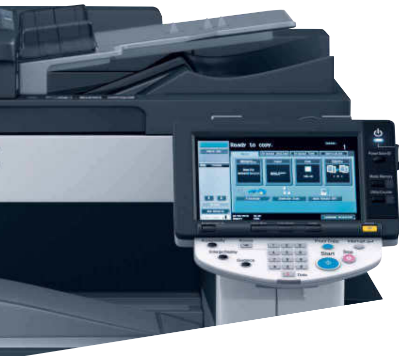
Das leicht bedienbare Farbdisplay der ineo 363

Die hohe Druckqualität in Verbindung mit einer großen Auswahl an Finishing-Funktionen ermöglichen es, selbst höherwertige Dokumente wie Broschüren inhouse zu drucken, zu lochen oder zu heften. Das steigert die Produktivität nachhaltig!